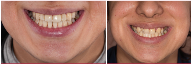
بعد از درمان